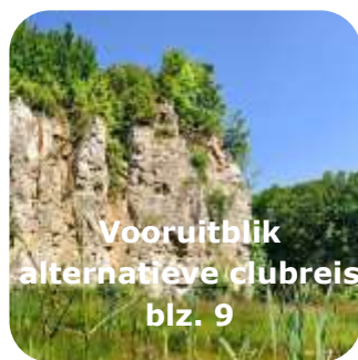
Vooruitblik alternatieve clubreis blz. 9