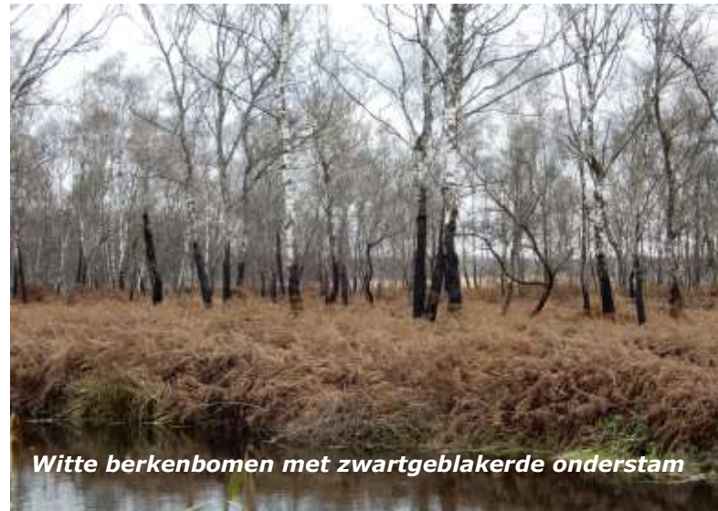
Witte berkenbomen met zwartgeblakerde onderstam

We komen nu in het gebied waar in 2020 de grote peelbrand woedde. Deze brand verwoestte in totaal 800 van de 1.000 ha van het natuurgebied. Daarmee werd de peelbrand in een klap de grootste natuurbrand die Nederland ooit meemaakte.