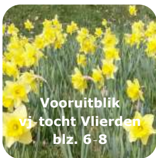
Vooruitblik Vj-tocht Vlierden blz. 6-8