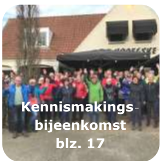
Kennismakings- bijeenkomst blz. 17