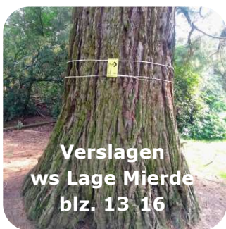
Verslagen ws Lage Mierde blz. 13-16